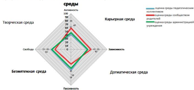
Графическая модель соотношения типов образовательной