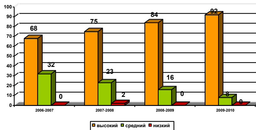
Диаграмма 7. Сравнительный анализ степени удовлетворенности родителей работой ДОУ

Высоко оценивают родители отношение к детям со стороны воспитателей и психологический климат в детских коллективах. Просветительская работа, информирование родителей о системе работы в ДОУ, активное привлечение их к сотрудничеству, позволили повысить удовлетворенность родителей работой ДОУ. Необходимо и в дальнейшем поддерживать заданный уровень, соответствовать ожиданиям родителей, совершенствовать работу по включению их в воспитательно-образовательный процесс, поиску эффективных методов работы.